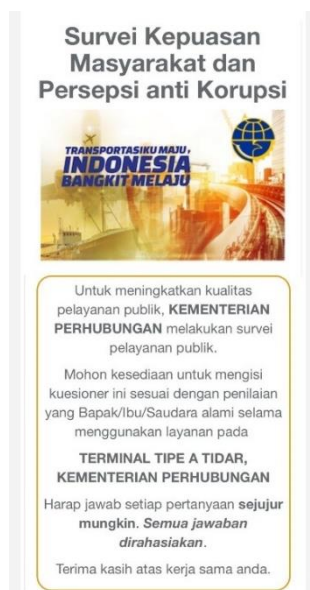
Gambar III.3 Survey Kepuasan Masyarakat Terminal Tipe A Tidar Magelang