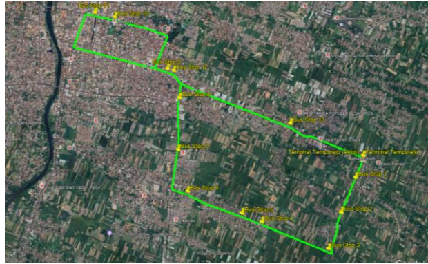
Gambar I.2 Rute Timur Bus SATRIA

Gambar I.2 menunjukkan lintasan operasional rute Timur Bus SATRIA yang menggunakan Terminal Tempurejo sebagai titik awal dan titik akhir perjalanan. Rute ini melintasi sejumlah ruas jalan strategis di wilayah timur dan pusat Kota Kediri, seperti Jalan Totok Kerot, Jalan Kapten Tendean, Jalan Letjen Sutoyo, Jalan Hayam Wuruk, Jalan Dhoho, Jalan HOS Cokroaminoto, dan Jalan Durian yang sebagian besar merupakan kawasan permukiman dan jalan kolektor. Rute Timur didominasi oleh ruas jalan kolektor dan arteri perkotaan dengan variasi kepadatan lalu lintas yang cenderung tinggi pada segmen pusat kota. Lintasan Rute Timur relatif lebih pendek dan memiliki distribusi kawasan aktivitas yang lebih rendah pada beberapa titik tertentu dibandingkan dengan rute Barat.