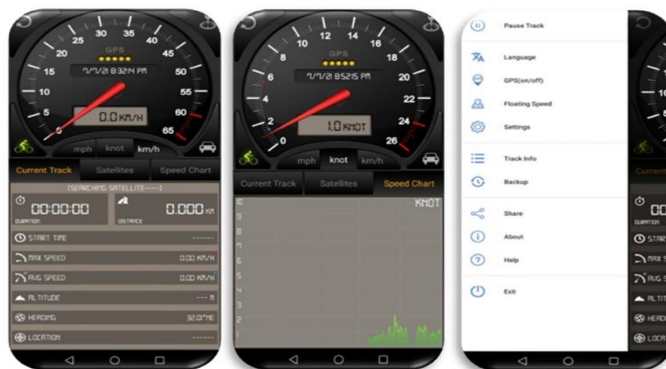
Gambar I.4 Tampilan Aplikasi Speedometer GPS

Pengambilan data GPS secara real time pada kendaraan dilakukan dengan memanfaatkan aplikasi Speedometer GPS . (versi 4.136) berbasis perangkat Android yang terpasang pada perangkat smartphone (Abdulwahid et al. , 2022). Aplikasi ini digunakan untuk merekam kecepatan kendaraan, koordinat lokasi, waktu tempuh, serta pola kecepatan selama perjalanan Bus Satria. Penggunaan Speedometer GPS dipilih karena aplikasi tersebut mampu menyajikan data kecepatan secara real time , akurasi, serta dapat menyimpan riwayat perjalanan untuk