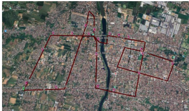
Gambar I.1 Rute Barat Bus SATRIA

Pengambilan data dilakukan pada dua rute utama, yaitu rute Barat dan rute Timur yang masing-masing dirancang untuk menjangkau wilayah dengan karakteristik dan kebutuhan mobilitas. Panjang rute yang dilalui angkutan perkotaan dari masing-masing rute adalah rute Barat sepanjang 20,33 km dan Rute Timur sepanjang 17 km.