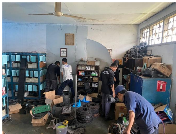
Gambar IV. 6 Menata Ulang Gudang