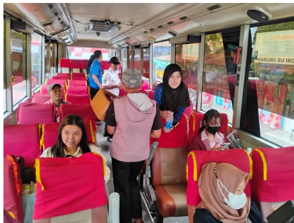
Gambar IV. 2 Kunjungan Ke Terminal

Kegiatan yang dilakukan meliputi administrasi usaha seperti penginputan beban operasional kendaraan, data kendaraan, dan pembuatan surat kas keluar