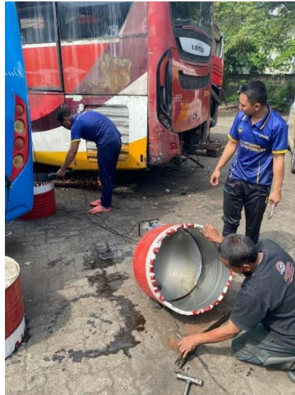
Gambar IV. 5 Pembuatan Tong Sampah

Kegiatan dilakukan untuk memastikan tetap terjaganya kebersihan lingkungan Teknik dan membantu mengurangi sampah berserakan seperti sisa material, plastik atau logam kecil dari hasil perbaikan.