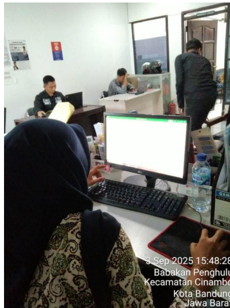
Gambar IV. 1 Kegiatan Adinistrasi Usaha

Kegiatan yang dilakukan meliputi administrasi usaha seperti penginputan beban operasional kendaraan, data kendaraan, dan pembuatan surat kas keluar