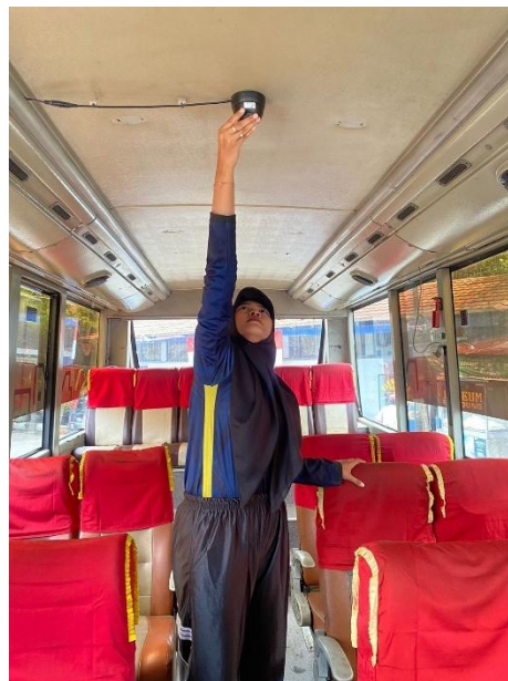
Gambar IV. 4 Pengecekan Armada

Kegiatan dilaksanakan dengan tujuan untuk Menyusun peta rute jaringan trayek yang dilayani oleh Perum DAMRI Cabang Bandung. Pembuatan peta tersebut bertujuan untuk mempermudah penumpang dalam memahami jalur perjalanan sekaligus meningkatkan efektivitas dan efisiensi operasional Perusahaan.