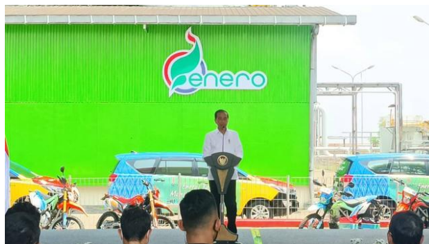
Gambar I. 2 PT Energi Agro Nusantara (Verdian, 2022)

Kementerian Energi Dan Sumber Daya Mineral Republik Indonesia Nomor: 432.Pers/04/SJI/2022 pada tanggal 4 november 2022 Presiden Jokowi meluncurkan program bioetanol tetes tebu untuk ketahanan energi. Peresmian ini dilaksanakan di sela kunjungan kerja di pabrik bioetanol PT Energi Agro Nusantara (Enero), Kabupaten Mojokerto, Jawa Timur. Presiden Jokowi mengharapkan program bioetanol ini dapat berjalan sesuai rencana, dimulai dari bioetanol 5% (E5) pada BBM kemudian meningkat E10, E20 dan seterusnya.