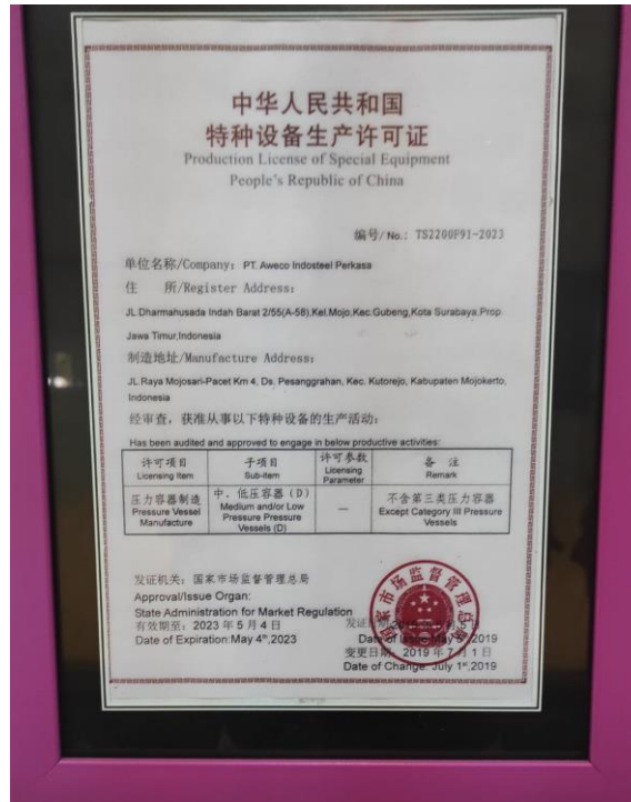
Lampiran 4. Certificate Boiler and Pressure Vessel Code Section VIII Div. 1.