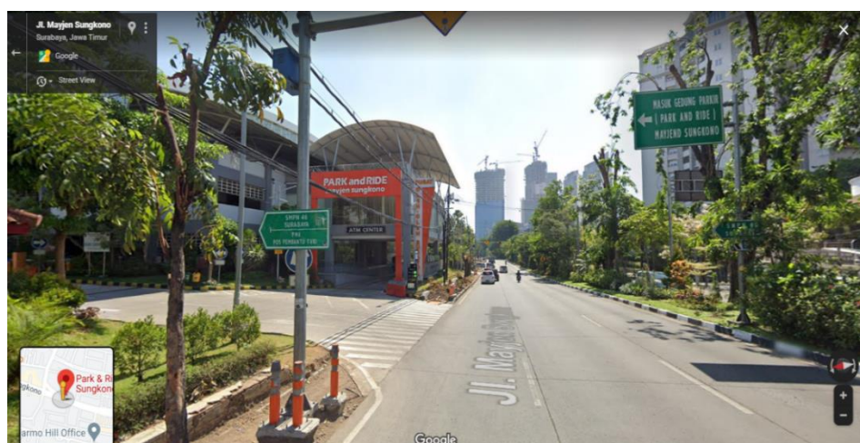
Gambar I. 2 Kantor BPTU Pengelola Transportasi Umum Suroboyo Bus